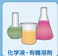
化学液・有機溶剤