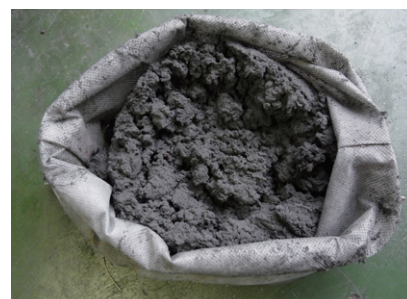
研削SK材スラッジ(脱水後)