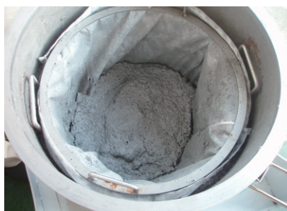
研削アルミスラッジ(脱水後)